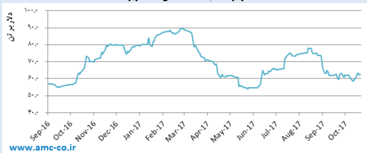
نمودار ۱ - قیمت سنگ آهن ۶۲٪ ریزدانه

همان‌طور که در نمودار مشاهده می‌شود، عوامل ذکر شده، باعث شده‌اند که سنگ آهنی که سال گذشته به طور میانگین ارزشی معادل ۵۸ دلار بر تن داشت، در ۳ ماهه نخست امسال، به طور میانگین، ۷۳ دلار بر تن معامله شود. مؤسسه وود مکنزی اعلام کرد که دلیل نخست این افزایش قیمت دیده شده نسبت به پیش‌بینی‌های قبلی، دست کم گرفتن تقاضای فولاد چین، خصوصاً تقاضای بخش‌های غیرمسکونی و زیرساخت‌های این کشور بوده است. دلیل دومی که این مؤسسه برای این رشد پیش‌بینی