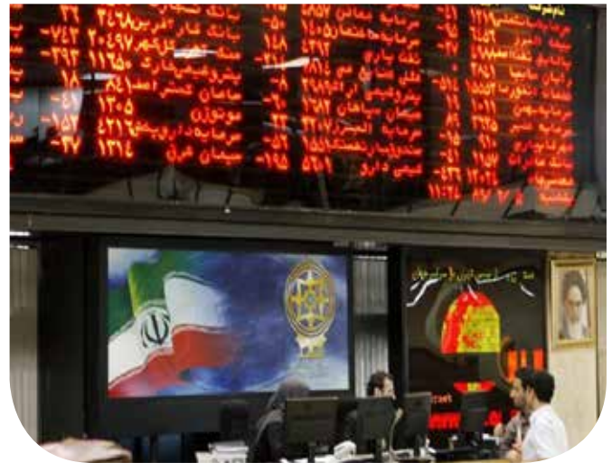
ارزش و حجم معاملات و بازار میدکو طی یک هفته گذشته