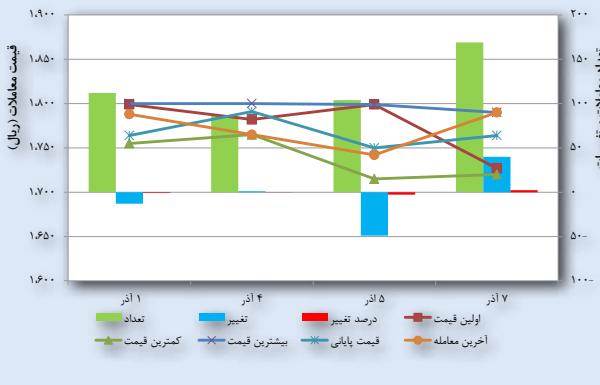
نمودار وضعیت قیمت و تغییرات سهام میدکو طی یک هفته گذشته در بورس اوراق بهادار

شاخص بورس در پایان آبان ۹۶ در مقایسه با مهر ۹۶، به میزان ۲ هزار و ۲۹۴ واحد برابر با ۲,۷ درصد افزایش یافت و از ۸۶ هزار و ۴۸۰ واحد به ۸۸ هزار و ۷۷۵ واحد رسید. ارزش بازار در پایان آبان ماه ۹۶ در مقایسه با پایان مهر ۹۶ به میزان ۷۹ هزار و ۳۴۴ میلیارد ریال رشد برابر با ۲ درصد افزایش یافت و از ۳ میلیون و ۴۶۳ هزار و ۳۸۳ میلیارد ریال به ۳ میلیون و ۵۴۲ هزار و ۷۲۸ میلیارد ریال رسید. براساس معاملات نرمال، در این ماه ارزش سهام خریداری شده اشخاص حقوقی در حدود ۱۷ هزار و ۲۳۳ میلیارد ریال و معادل ۵۰ درصد از کل خریدها بود، در حالی که ارزش سهام فروخته شده آن‌ها ۱۶ هزار و ۸۲۲ میلیارد ریال و در حدود ۴۹ درصد از کل فروش‌ها بود. بر این اساس در این ماه سرمایه‌گذاری خالص اشخاص حقوقی به میزان ۴۱۱ میلیارد ریال شد. در عین حال میزان خرید و فروش سهام اشخاص حقیقی به ترتیب ۴۹ و ۵۰ درصد از ارزش خرید و فروش بود.